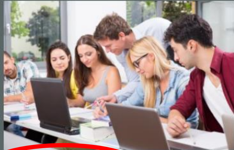
Fit für die Facharbeit