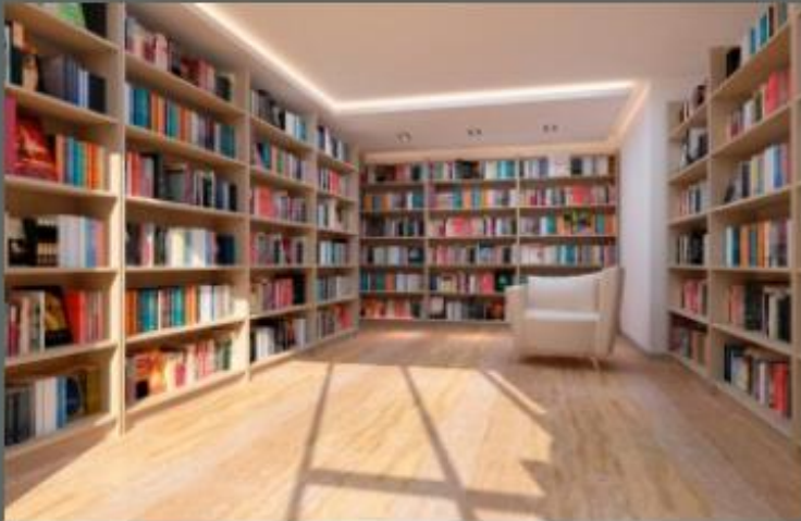
Führung von Schulklassen/Gruppen