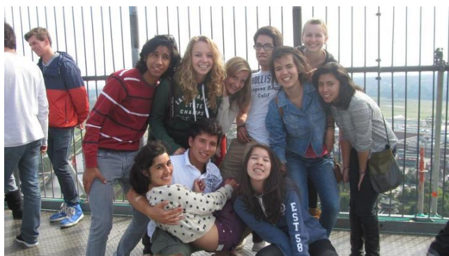
Mit anderen Austauschschüler in Oberhausen